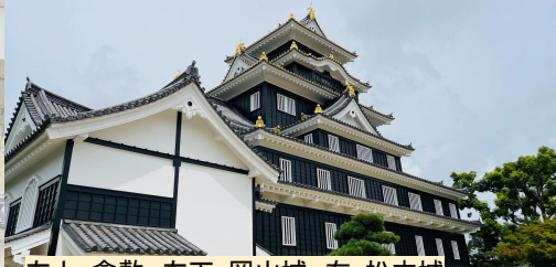
左上:倉敷 左下:岡山城 右:松本城